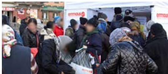
Vid en Freeshop på Järntorget i Göteborg delades varma kläder och skor ut till personer som lever i utsatthet.

Angola har idag, tack vare tillgången på olja, en av Afrikas snabbast växande ekonomier. Endast en liten del av befolkningen får ta del av denna utveckling och de sociala och ekonomiska klyftorna i landet ökar. För att få en jämlik fördelning av Angolas resurser är ett starkt civillsamhälle avgörande.