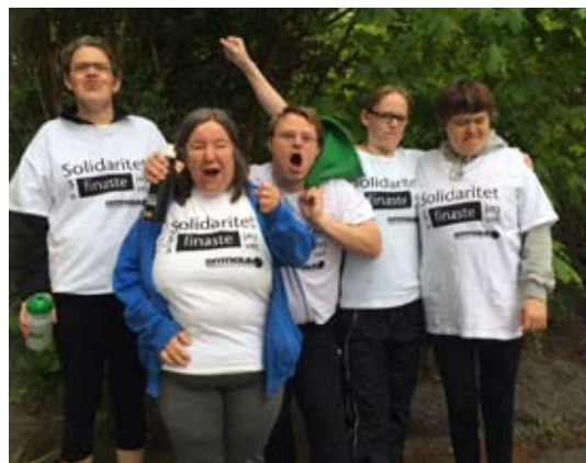
Deltagare från Daglig Verksamhet i Lysekil firar målgången i SpecialVarvet i Göteborg.

Den 30 juni avslutades projekten "Aktivism – en väg till jobb inom social ekonomi" i Göteborg respektive Malmö. Projekten genomfördes med