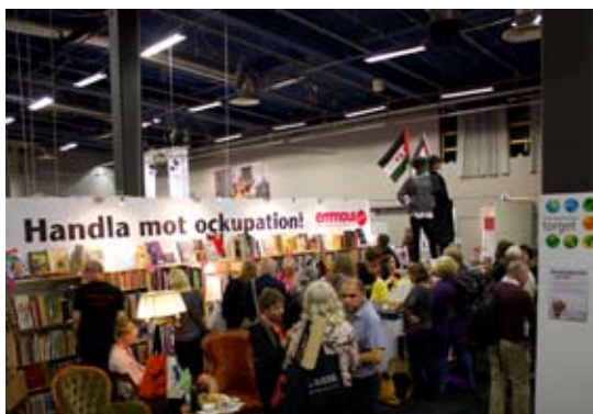
Emmaus Björkå stod för den mest välbesökta monter på Internationella torget på bokmässan i Göteborg.

Emmaus Björkås bedriver opinionsarbete för att uppnå ett rättvisare samhälle. Mycket av opinionsarbetet utgår från de solidaritetsprojekt vi stödjer och därför har kampen för ett fritt Palestina och Västsahara varit i fokus men även anti-rasism, feminism och kampen mot fattigdom i Sverige är ständigt aktuella ämnen.