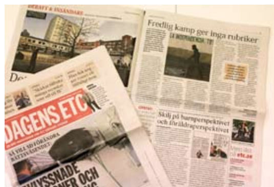
Debattartikel om Västsahara i Dagens ETC, signerad av Emmaus Björkås föreningschef och EU-parlamentarikern Malin Björk (v).

Emmaus Björkå har under 2014 anordnat eller deltagit i en lång rad utåtriktade events. Bland annat medverkade föreningen på Bok & Biblioteksmässan där vi höll i två fullsatta seminarier om "feminism under ockupation". Emmaus Björkås medlemmar har också bedrivit opinionsarbete på gator och torg med flera olika kampanjer.