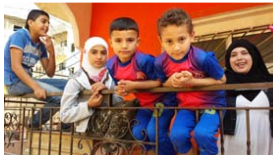
Palestinska flyktingar från Syrien på PCYI:s barn- och ungdomscenter i flyktinglägret Nahr el-Bared i norra Libanon.

Organisationen Palestinian Child and Youth Institute (PCYI) arbetar med barn och unga samt