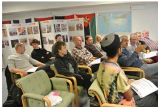
Diskussion bland medlemmar under det tredje mötet på temat Strategi 2015-2020.

I butiks- och sorteringsverksamheten har sammanlagt ett tiotal volontärer återkommande hjälpt till med det löpande arbetet.