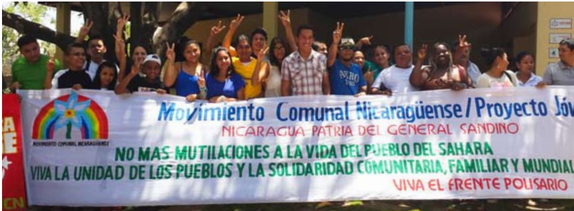
Ungdomar i MCN firar att de nu startar ett projekt som handlar om solidaritet med Västsahara.