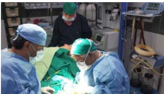
En palestinsk flykting från Syrien får gratis vård på Human Call Associations sjukhus i flyktinglägret Ein el-Helweh i södra Libanon.

fortsatt med sin förskoleverksamhet som riktar sig till ca 120 barn. Förskolan har erkänts lokalt för sina pedagogiska metoder och ger mödrarna möjlighet att träffas och komma utanför hemmen. Projektet genomfördes med stöd av Radiohjälpen.