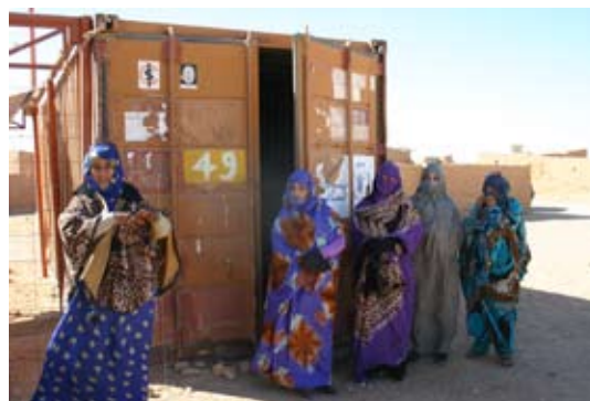
Kvinnorna som ansvarar för utdelning av de skor Emmaus Björkå skickat till de västahariska flyktinglägren.

Svensk Insamlingskontroll kontrollerar vår verksamhet och vi har två 90-konton, pg 90 01 71-0 och bg 900-1710.