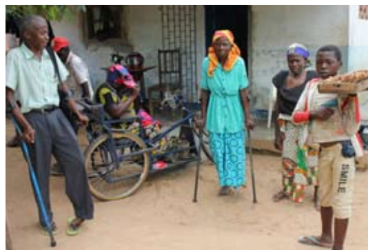
Ademo Monapos medlemmar kan få stöd för att söka vård eller utbildning.