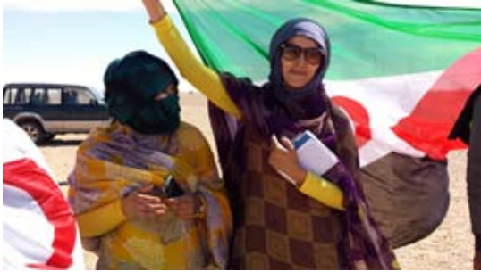
Organisationen Cries against the wall demonstrerar för ett fritt Västsahara.